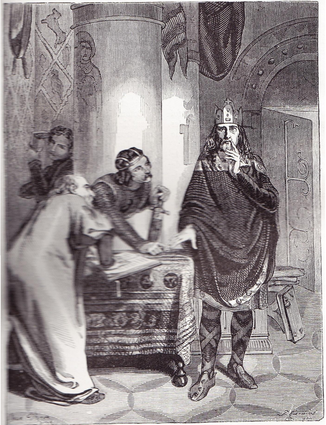
Charlemagne dictant ses Capitulaires à Alcuin. Page 44, col. 2.)