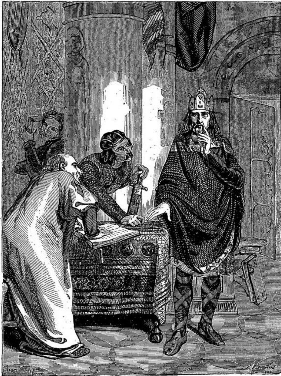
Charlemagne dictant ses Capitulaires à Alcuin. (Page 44, col. 2.)

En 804, Charlemagne députa dans les diverses provinces de France des commissaires chargés de