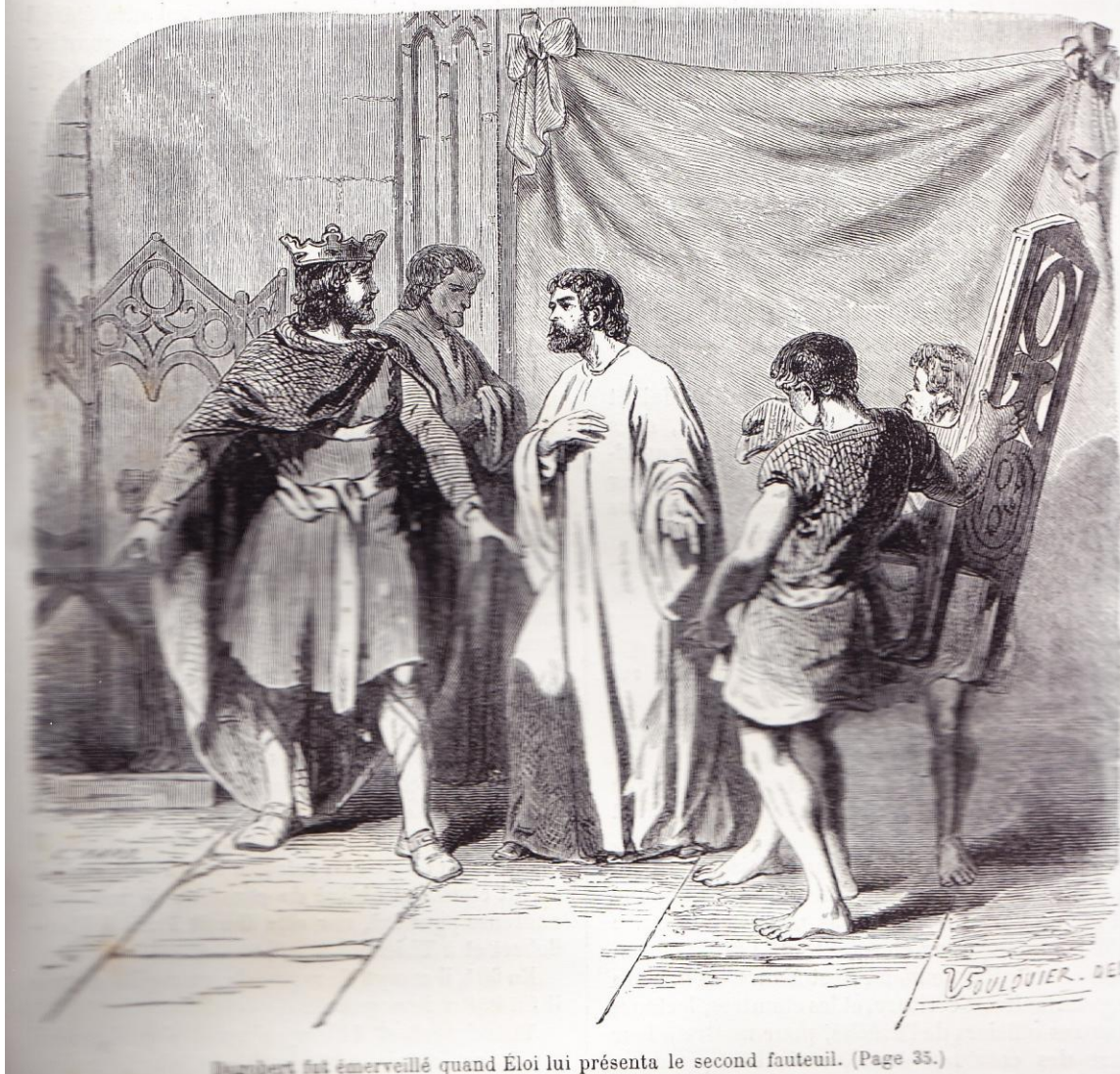
Dagobert fut émerveillé quand Éloi lui présenta le second fauteuil. (Page 35.)

avec les trois évêques et de 300 personnes qui affirmèrent que Clovis était né sous la couverture.