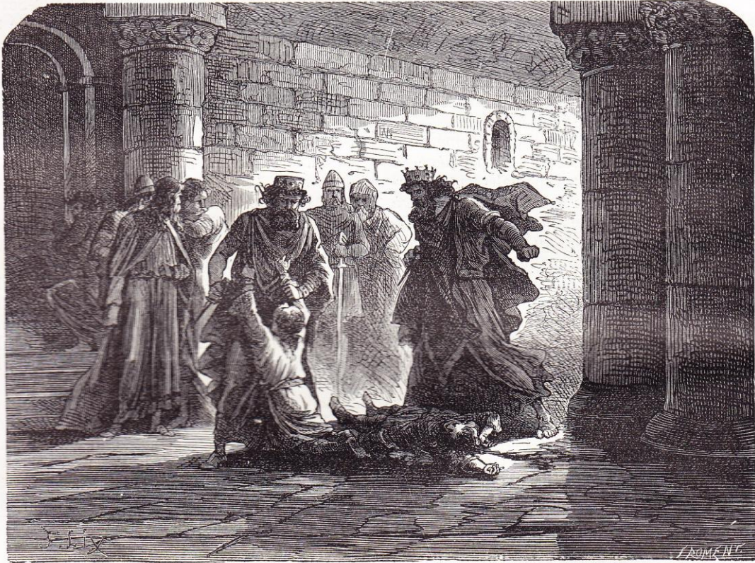
Childebert et son frère Clotaire s'entendirent pour assassiner leurs neveux, fils de Clodomir.

Les dames se promenaient dans des litières à dos de mulets.