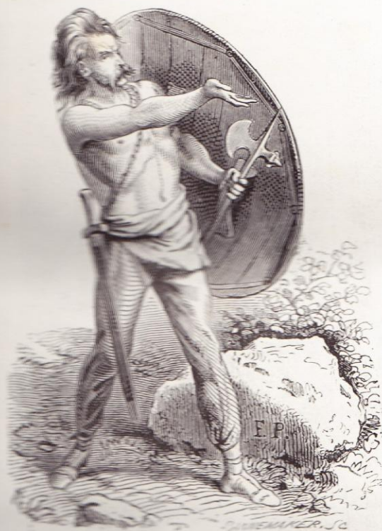
Les Gaulois se battaient nus jusqu'à la ceinture.

de mouton, de loup ou de blaireau, cousue avec un crin, le poil en dehors. Ce vêtement se complétait par le camisia (chemise) et les brayes. Leur manteau en peau de chèvre s'appelait alors rochet . Ils se coiffaient du pileum , sorte de calotte de feutre, du petasus , chapeau à longs bords, et du berrus , bonnet pointu en laine assez semblable au bonnet corse appelé Birro .