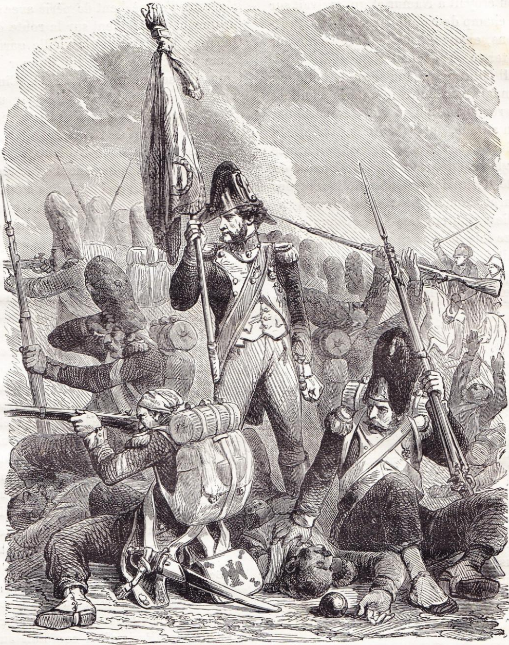
Episode de Waterloo.

le champ de bataille si leur général avait conservé une ligne de retraite ; leurs fuyards portèrent jusqu'à Bruxelles le bruit de la défaite de Wellington.