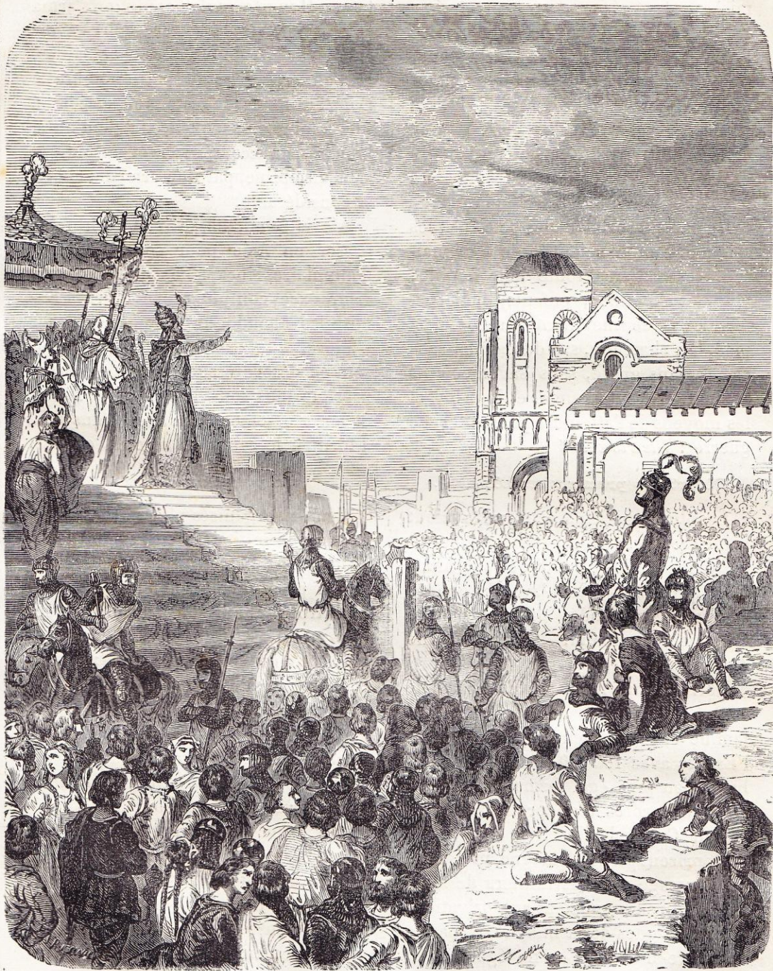
Prédication de la première croisade.

tous prirent la croix, les uns pour se sanctifier, d'autres pour faire pénitence, la plupart avec l'arrière-pensée du bu-