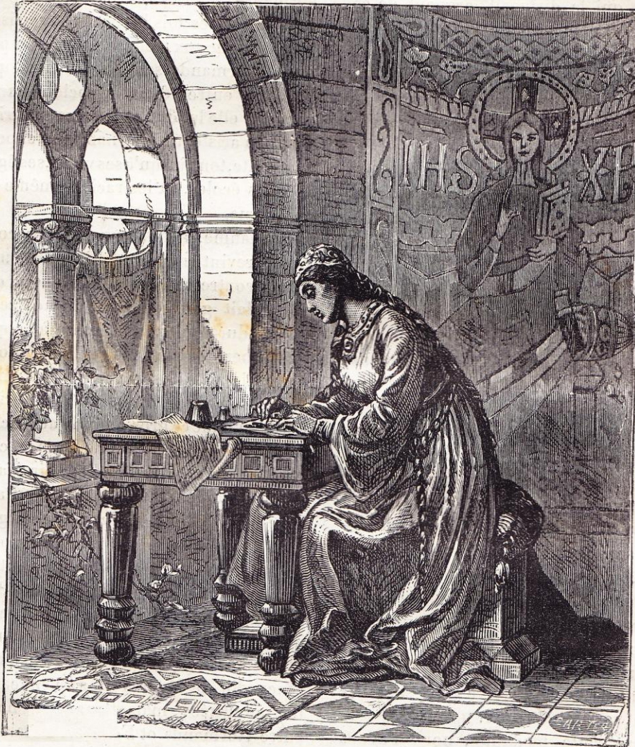
Bertrade à Fontevrault.

Les Anglais, déjà fort mécontents d'avoir vu tous les grands emplois oc-