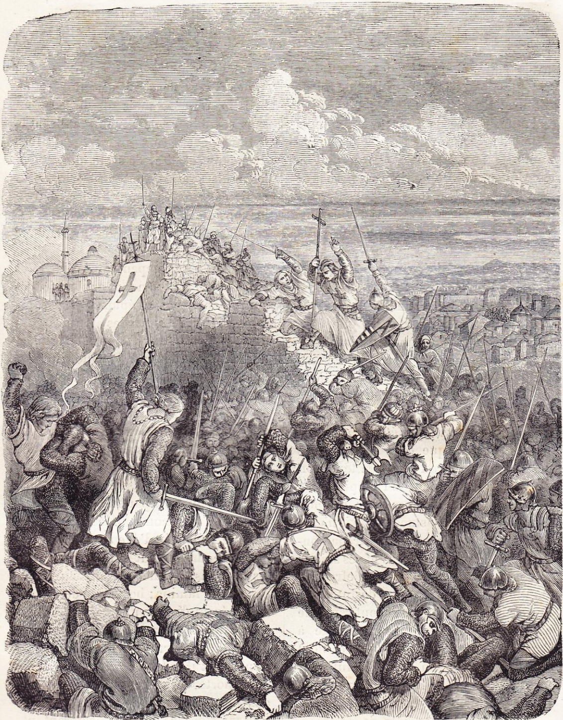
Prise de Jérusalem (1099).

amena la ruine de l'empire des Seldjocides, les Fatimites ayant profité de cette diversion pour rentrer dans