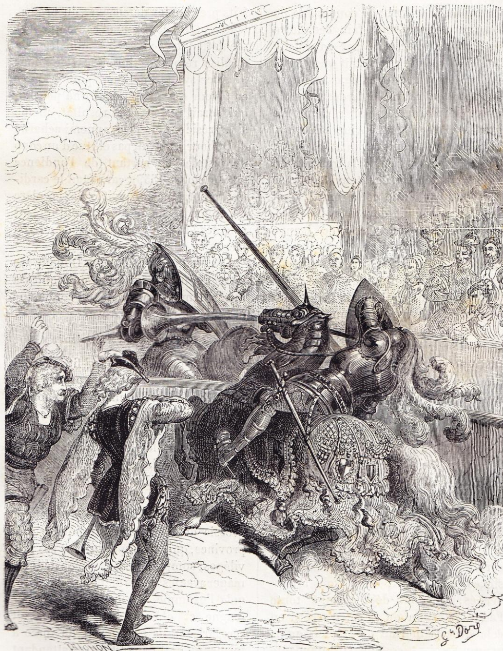
Mort de Henri II (1559).

puis la galanterie jusqu'à l'assassinat, lui semblèrent bons pour conserver le pouvoir à ses fils, et elle ne s'étudia à gouverner qu'en prenant les hommes par leurs mauvaises passions, sans ré-