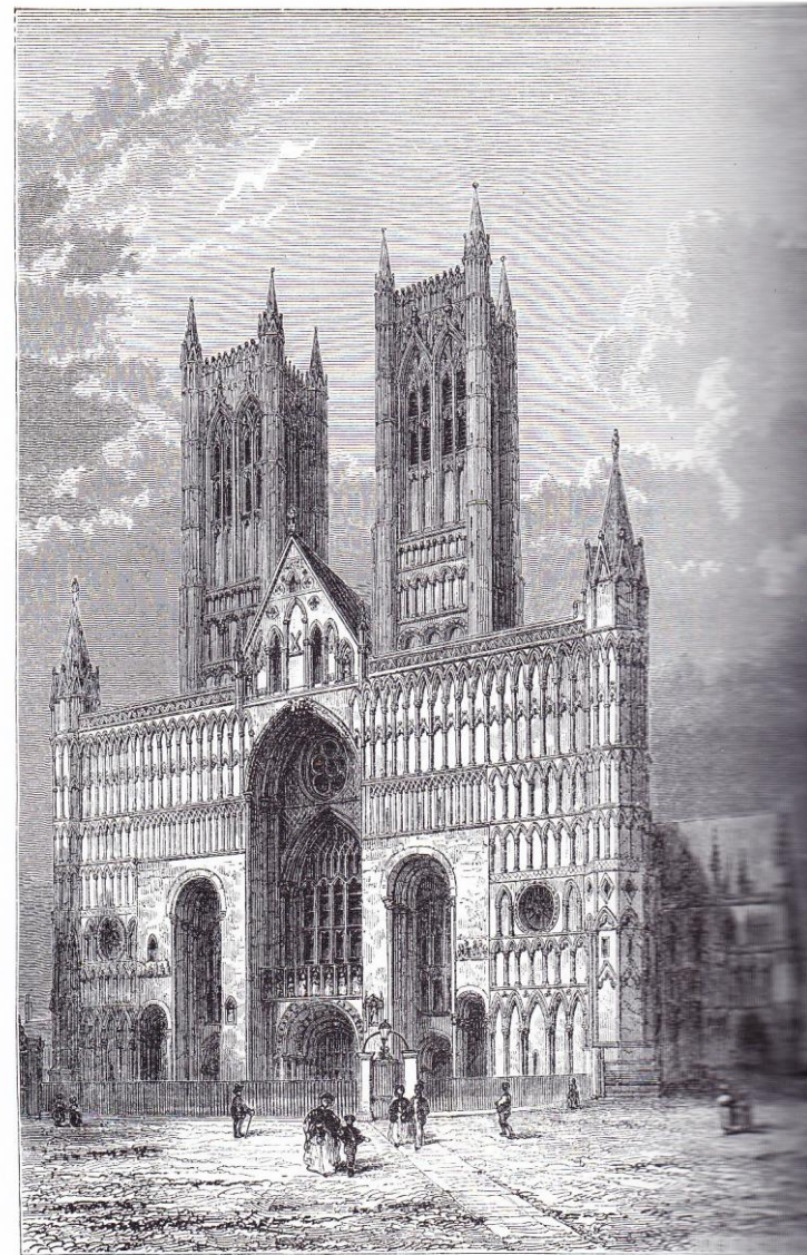
CATHÉDRALE DE LINCOLN.