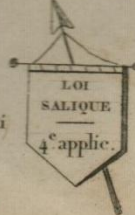
LOI SALIQUE 4 e applic.