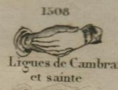
1508 Ligue de Cambrai et sainte