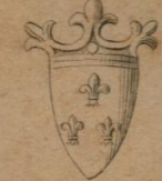
Ecu de France

2 e Maison d'Anjou. Louis 1, 2, 3. René 1382 ..... 1422