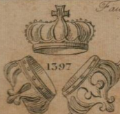
Union des 3 couronnes.