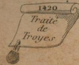
1420 Traite de Troyes