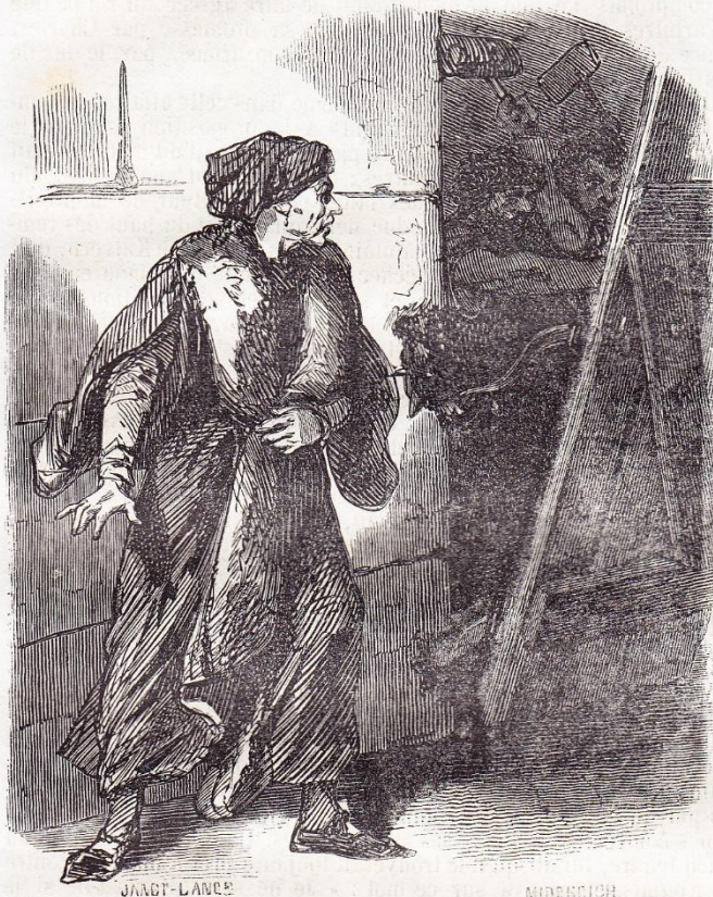
Hugues Aubriot tiré de sa prison par les Maillottins. Page 465.

Certain de sa mort, Charles V en aurait presque pu marquer le moment. Il la vit avancer avec le calme d'un chrétien résigné, et fit ses dispositions avec l'attention d'un sage. Il paraît qu'il aurait désiré ne pas confier la régence, la destinée de ses enfants et de la France à son frère le duc d'Anjou. Le ton qu'il avait pris dans l'affaire de Bretagne, ses remontrances hautaines, surtout les singulières conditions de la suspension d'armes, comme s'il eût prétendu faire la loi à son frère, ses vues ambitieuses, qu'il connaissait, lui inspiraient des soupçons et des craintes. Mais le duc d'Anjou était l'aîné; il aurait sans doute été imprudent de lui fournir un sujet de plaintes d'où auraient pu naître des troubles. Charles lui laissa donc la régence. Il se contenta de donner à ses deux autres frères, au duc de Bourbon, son beau-frère, et à d'autres seigneurs qu'il admit à sa confiance, des avis propres à faire échouer les projets dangereux du duc, s'il en avait. Comme c'était d'Allemagne que les Anglais tiraient une grande partie de leurs forces de terre quand ils avaient la guerre sur le continent, le roi recommanda qu'on donnât à son fils pour épouse, quand il serait en âge, une Allemande, afin de contre-balancer du moins les alliances que l'Angleterre entretenait dans ce pays, et qu'elle cherchait à augmenter par le même moyen d'un mariage pour son jeune roi Richard. Vanité de la prévoyance humaine! c'est cette précaution qui a