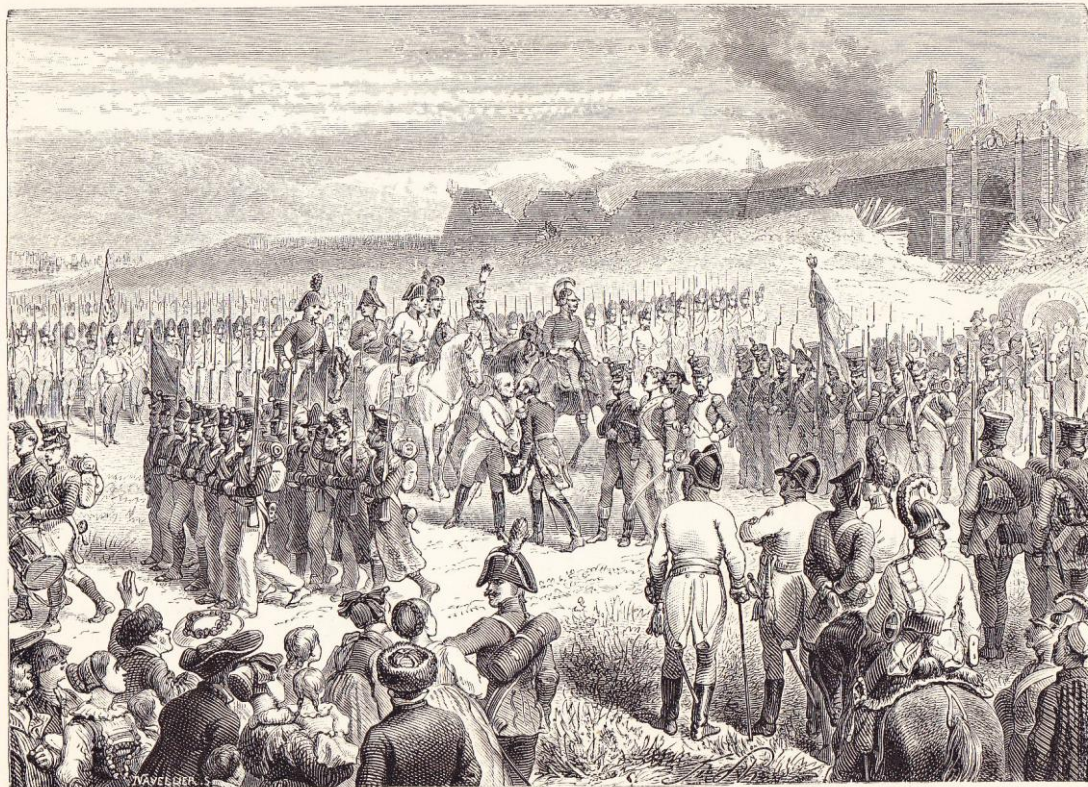
Reddition de Huningue (27 août 1815).

« Reddition de Huningue (27 août 1815) »