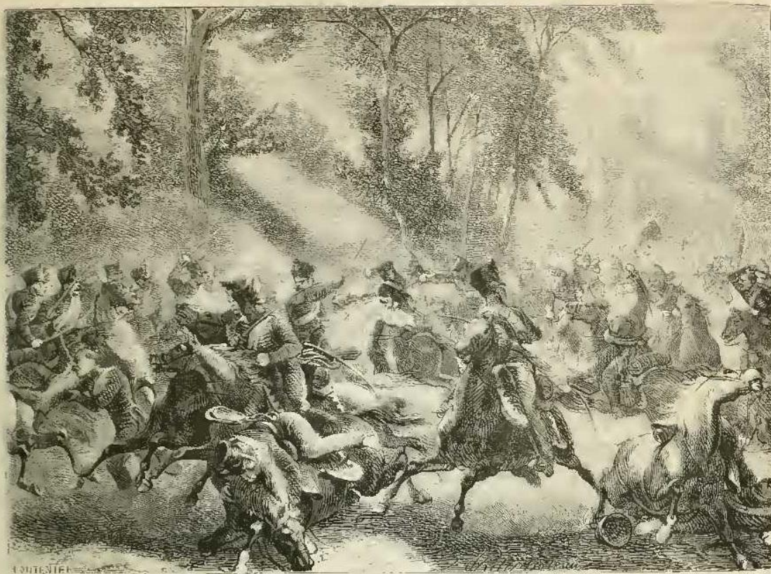
Combat de Roquencourt.

la capitale aux Anglo-Prussiens, en confiant la ville à la garde nationale. Désirant que ce qui allait se faire pût durer, il avait le bon sens de souhaiter que les Bourbons fussent restaurés par la garde nationale plutôt qu'introduits de force dans Paris par les baïonnettes étrangères.