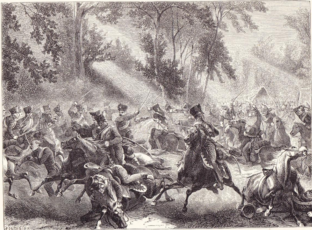
Combat de Rocquencourt (1813).

« Combat de Rocquencourt (1 er juillet 1815) »