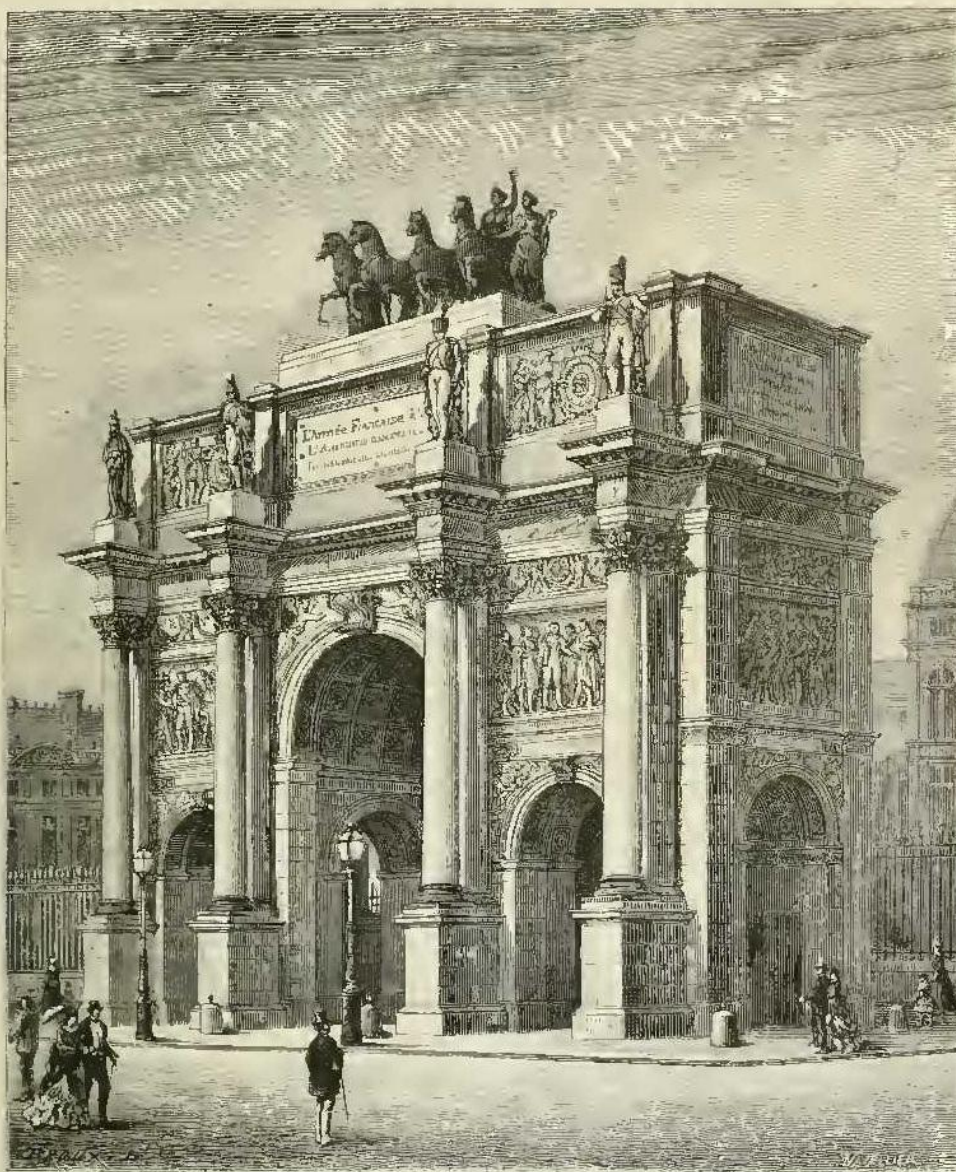
Arc de Triomphe du Carrousel.

abaissée et vaincue. C'est au delà du Rhin qu'on trouvait maintenant les philosophes et les poètes, les successeurs de Voltaire, de Rousseau, de Buffon, en même temps que ces grands musiciens qui sont, dans leur art, les égaux des grands architectes français du Moyen-âge et des grands peintres italiens de la Renaissance.