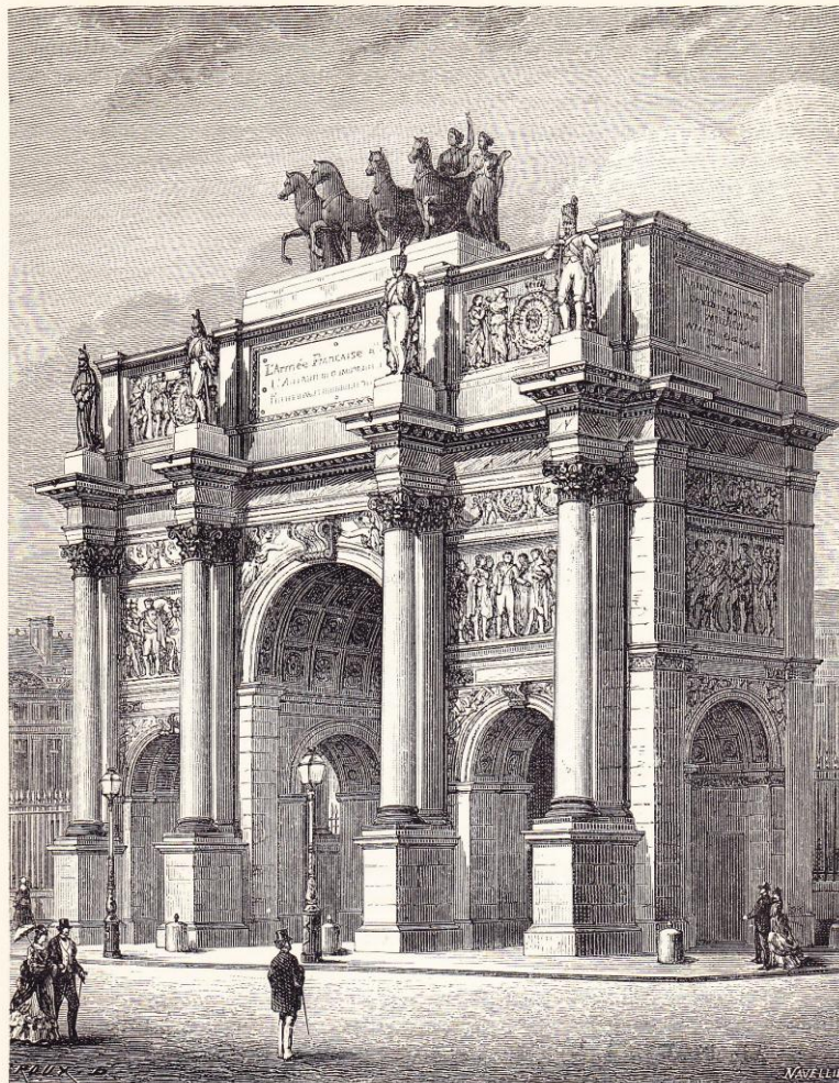
L'arc de triomphe du Carrousel (1806).

« L'arc de triomphe du Carrousel (1806) »,