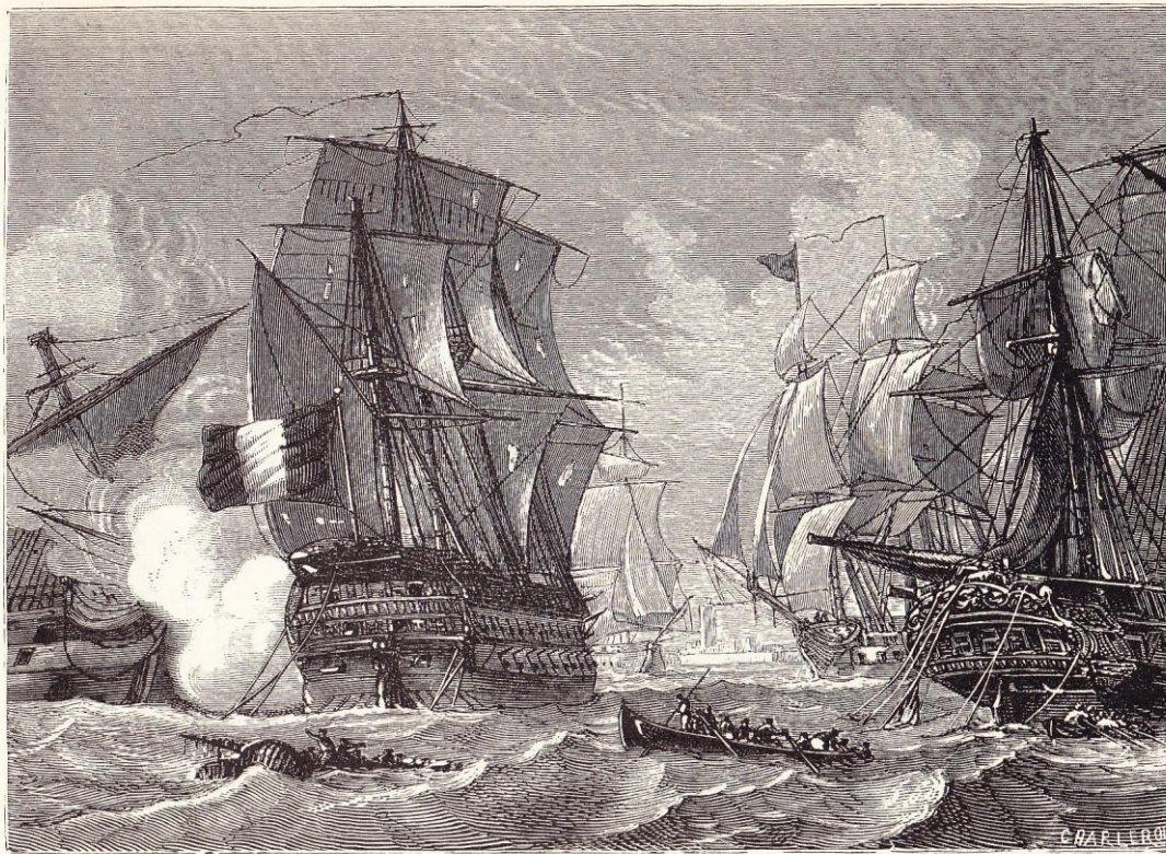
Combat du Formidable (capitaine Troude) (juillet 1801).

« Combat du Formidable – capitaine Troude (13 juillet 1801) »