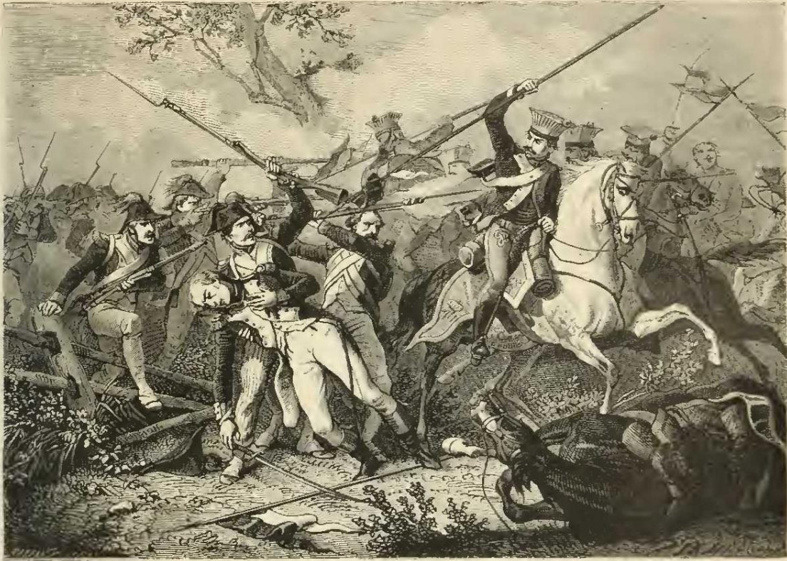
Mort de La Tour d'Auvergne.

il se déchainait contre « ces méchants hérétiques d'Anglais ! »