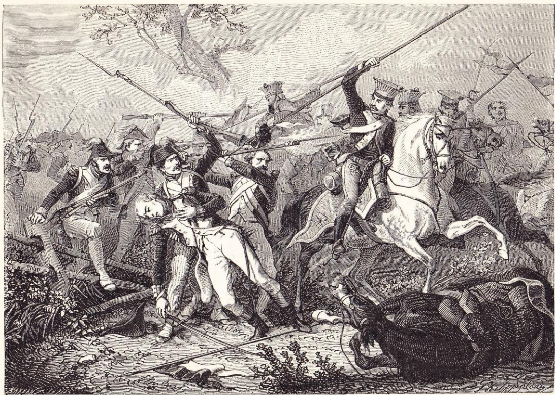
Mort de La Tour d'Auvergne (27 juin 1800).

« Mort de la Tour-d'Auvergne (27 juin 1800) »,