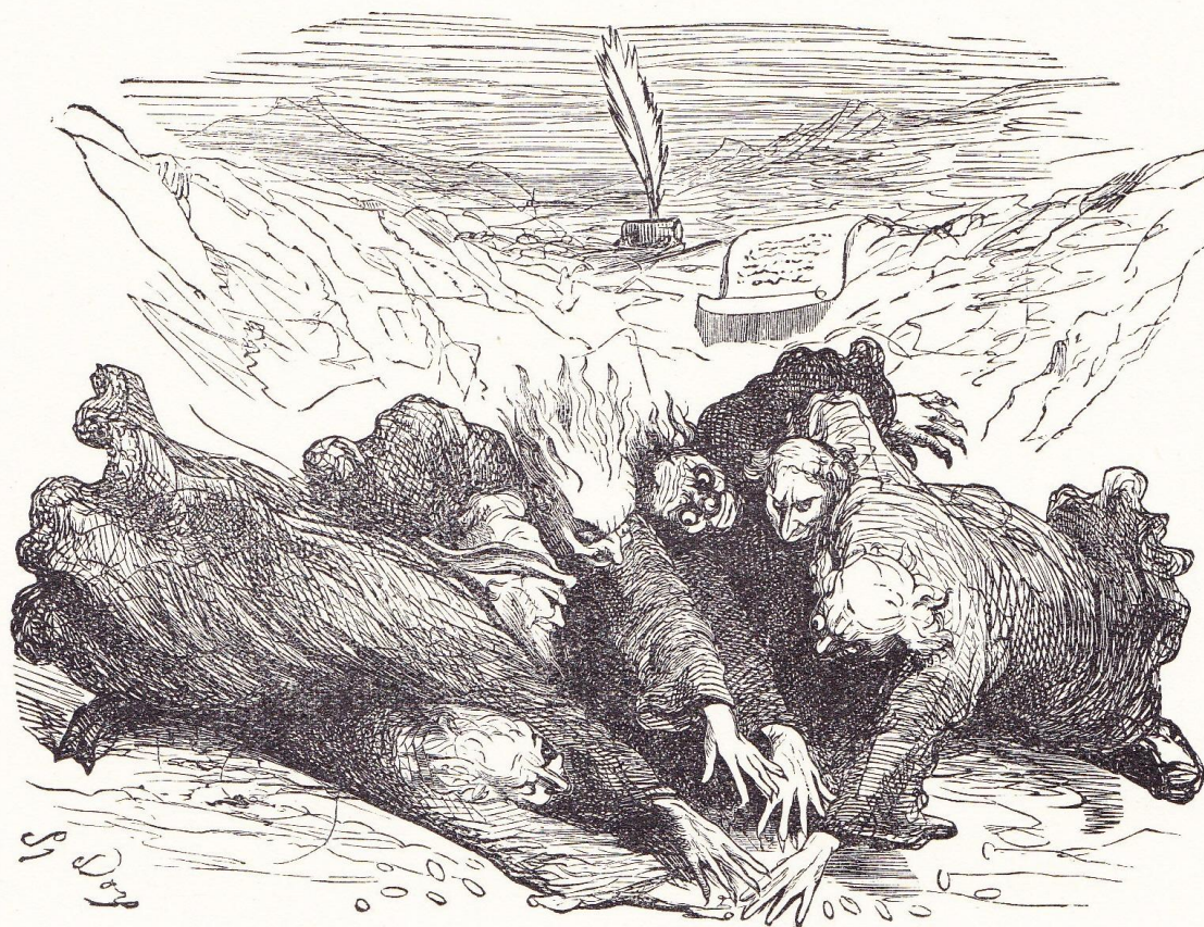
Dessins de Gustave DORÉ, gravés par SOTAIN pour les Œuvres de Rabelais , 1858. (Coll. Garnier; pl. originales.)