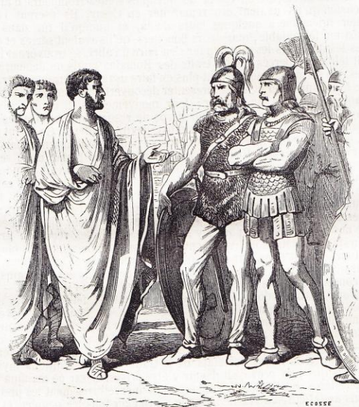
Les trois Fabius devant les Gaulois. Page 4.

César entra alors dans la carrière des grandes dignités. Propre-