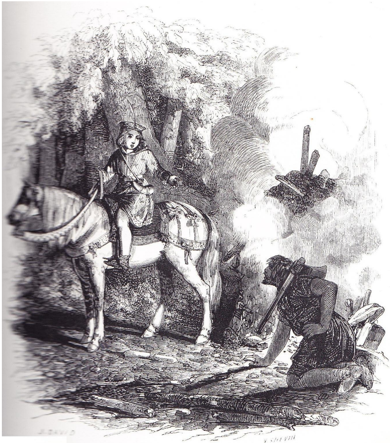
Philippe-Auguste, enfant, égaré la nuit dans la forêt de Compiègne.