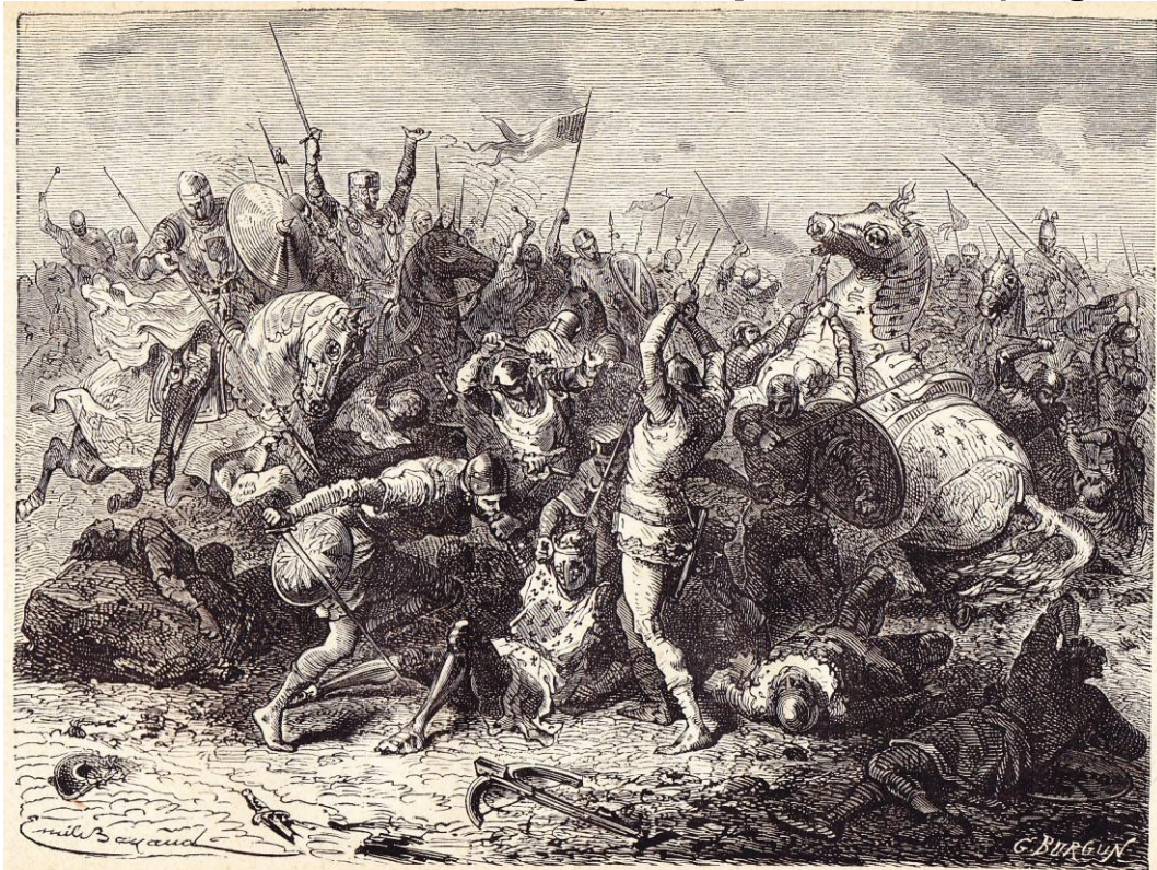
Bataille de Bouvines.

SEVERIN , Histoire de la Belgique en images / Geschiedenis van België in prenten ; page 53