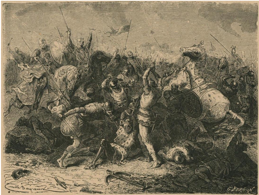
99. — Bataille de Bouvines, près de Tournai (27 juillet 1214). Le roi Philippe-Auguste désarçonné. Slag van Bovines, bij Doornik (27 e Juli 1214). Koning Philippe-Auguste uit den zadel gelicht.