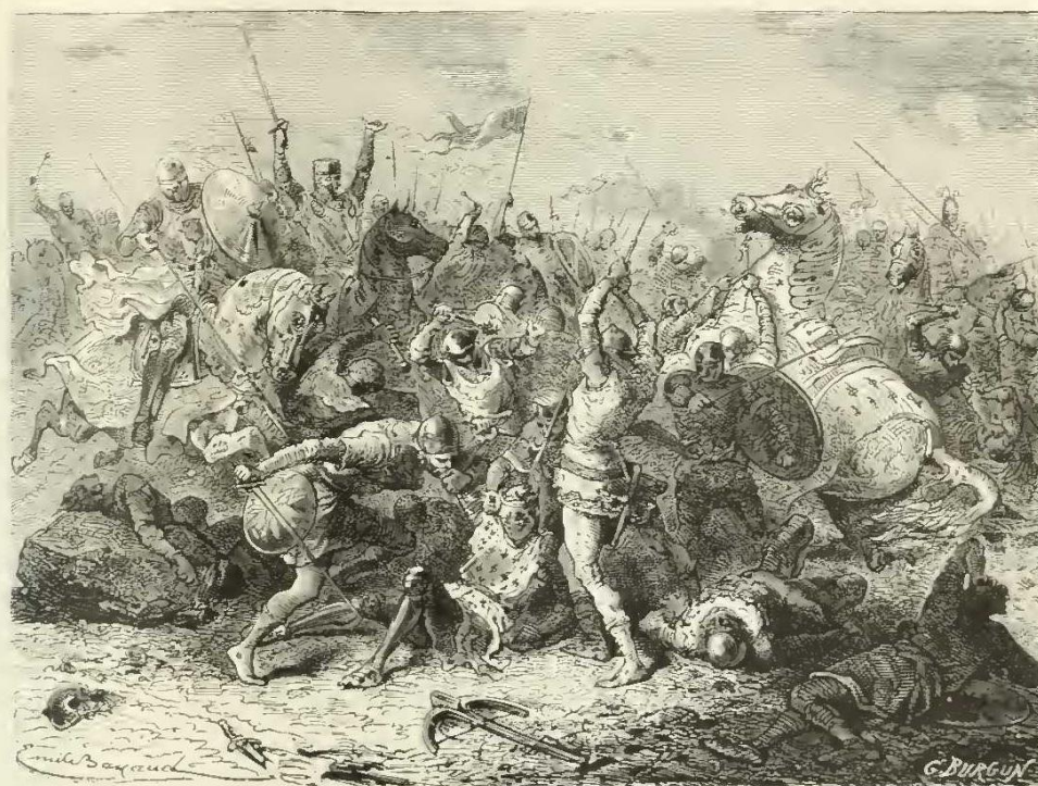
Bataille de Bouvines

Philippe-Auguste convoqua ses barons à Soissons (8 avril 1213), pour leur annoncer qu'il allait passer le détroit et renverser le tyran excommunié. Tous les barons, sauf le comte de Flandre, gendre et successeur de l'empereur Baudouin dans ce comté, promirent au roi de le suivre. Philippe leur donna rendez-vous à Rouen, et fit assembler une grande flotte.