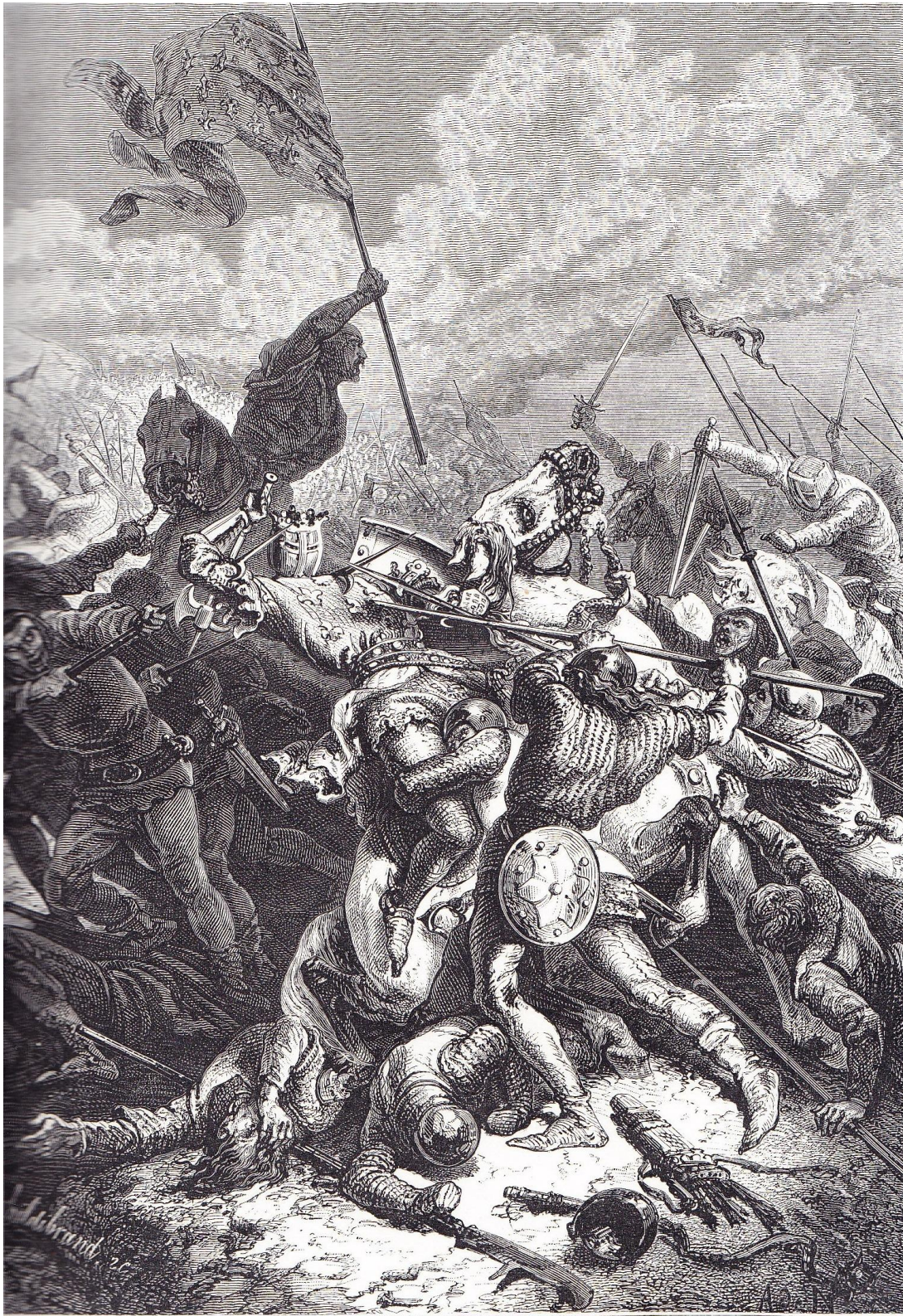
LA BATAILLE DE BOUVINES

« La Bataille de Bouvines », F. GUIZOT , L'histoire de France ... à la page 465 (1872)