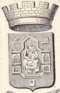
ARMES DE MONTPELLIER