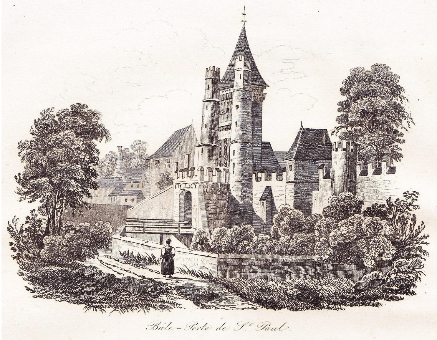
Bâle - Porte de S. t Paul.