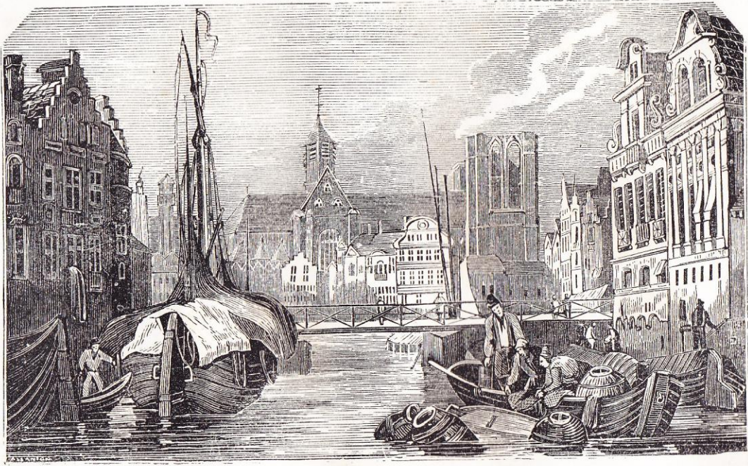
* Gand, p. 131.