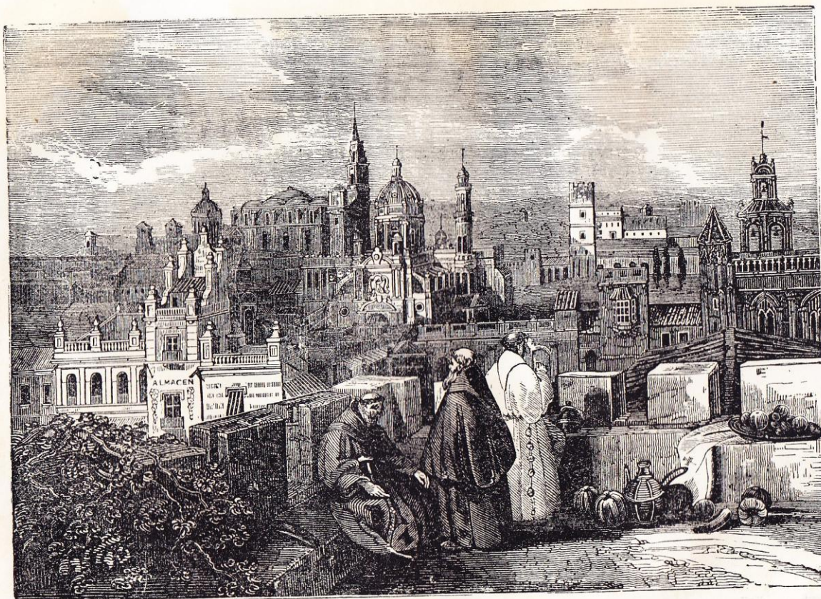
Vue de Xérès, page 166.