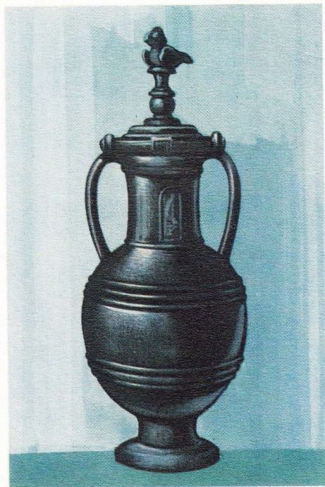
Vaas uit Etrurië

In de X e eeuw vóór J.C. ongeveer kwam de Italische bevolking bezit nemen van het schiereiland. Het waren de Ombriërs, de Sabijnen, de Samnieten en de Latijnen.