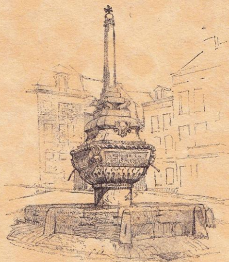
Stavelot. La fontaine.

MÉMOIRE COURONNÉ PAR L'ACADÉMIE ROYALE DE BELGIQUE