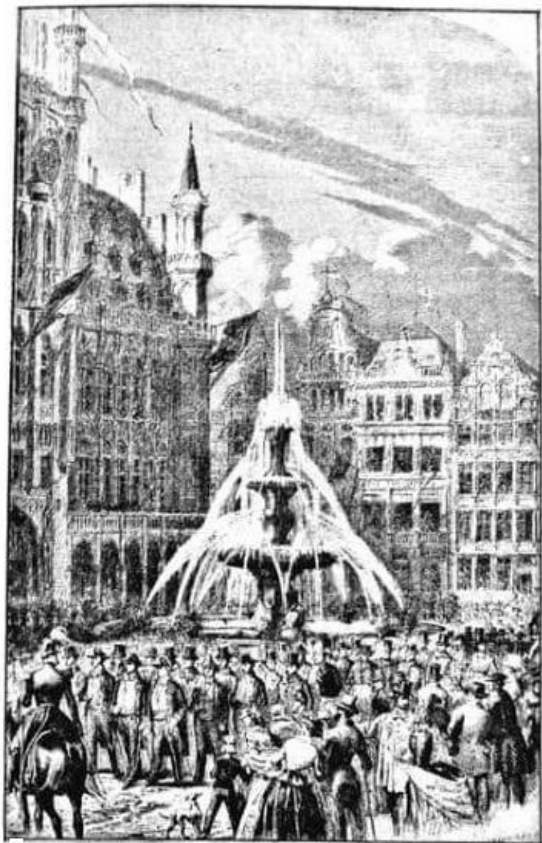
FONTAINE ÉLEVÉE SUR LA PLACE DE L'HOTEL DE VILLE (1856)