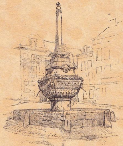
Stavelot. La fontaine.

MÉMOIRE COURONNÉ PAR L'ACADÉMIE ROYALE DE BELGIQUE