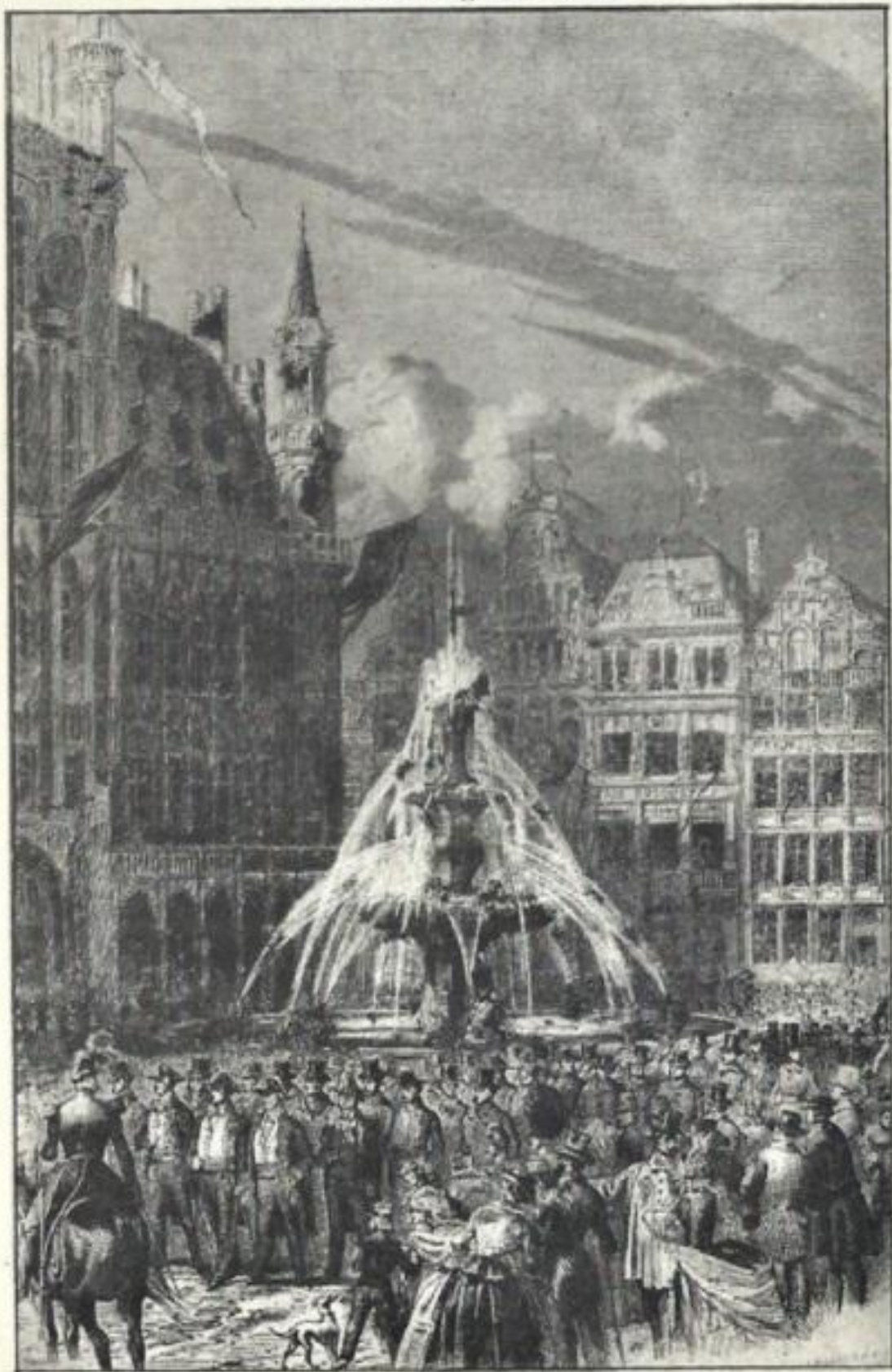
22. 21 Juillet 1856. 25 me anniversaire de l'inauguration du Roi Léopold I er . Le cortège, Grand'Place, à Bruxelles.