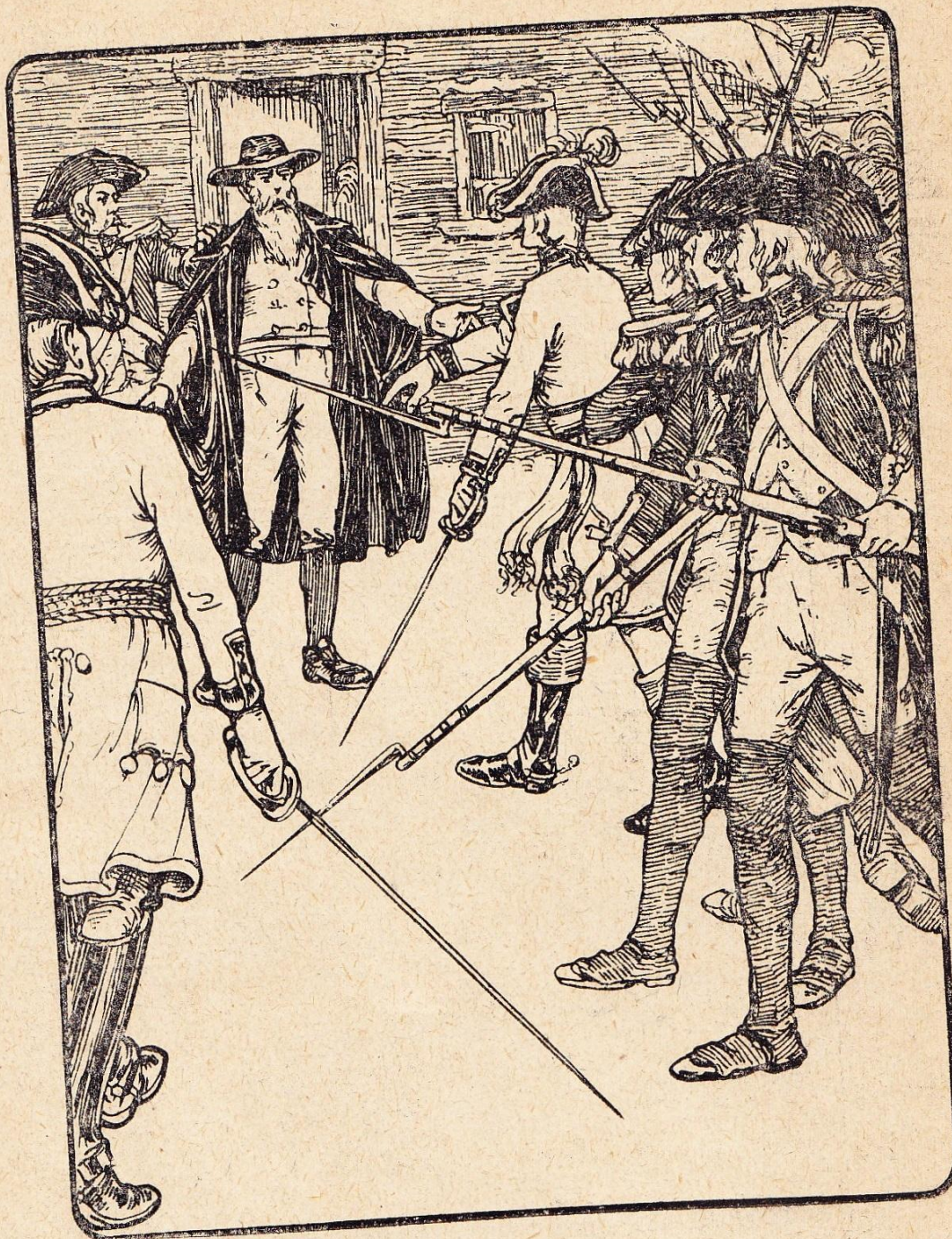
Aanhonding van een Vendeër