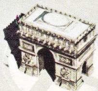
Arc de Triomphe

Onder Napoleon kende de stad belangrijke wijzigingen. Hij vertrouwde haar bestuur toe aan de prefect van het Seinedepartement en droeg de handhaving van de orde op aan de "préfet de police", die beiden door de regering werden benoemd. Deze regeling is tot op heden zo gebleven. Ter herinnering aan zijn krijgstochten en zegepralen liet Napoleon tal van bruggen en monumenten (de Vendômezuil en enkele triomfbogen) oprichten. Tijdens de restauratie en na de julimonarchie kende Parijs, ook dank zij de ontwikkeling van de grootnijverheid, een zeer sterke uitbreiding. Waren er in 1826 slechts 750 000 inwoners, dan telde de stad nauwelijks 20 jaar later reeds 950 000 burgers. De zogenaamde omwalling van Thiers — die 33 km lang was en talrijke buitengemeenten als Passy, Auteuil, Belleville en Montmartre bij de oorspronkelijke agglomeratie insloot — werd van 1840 tot 1845 aangelegd. Nochtans zou Parijs pas onder Napoleon III het uiterlijk krijgen dat wij vandaag nog kennen. Hij benoemde in 1853 Georges Eugène Haussmann