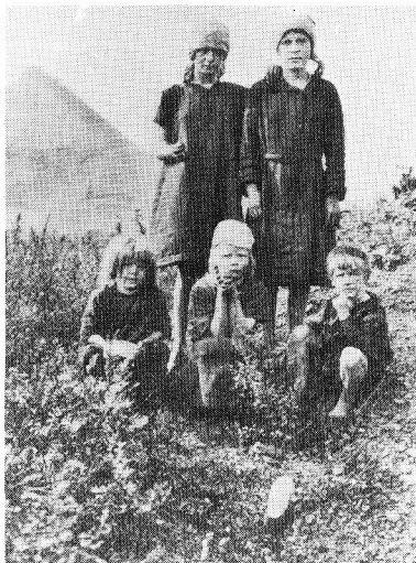
Un groupe de petites glaneuses. Marchienne-au-Pont (Carte postale)