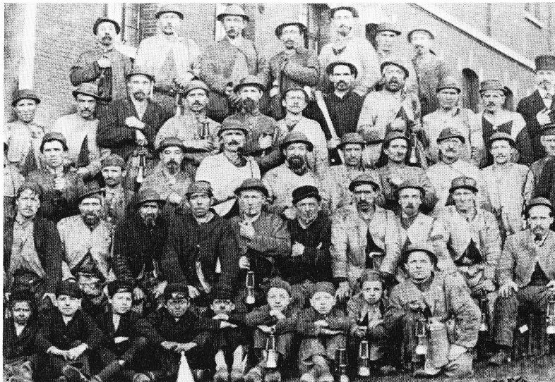
Gruppe de mineurs à Mariemont.

Enquête de 1843 sur le travail des enfants. Rapport de la Chambre de Commerce de Charleroi. Cité par Jean Neuville, La condition ouvrière au 19 e siècle , Ed. Vie Ouvrière, 1976, t. 1.