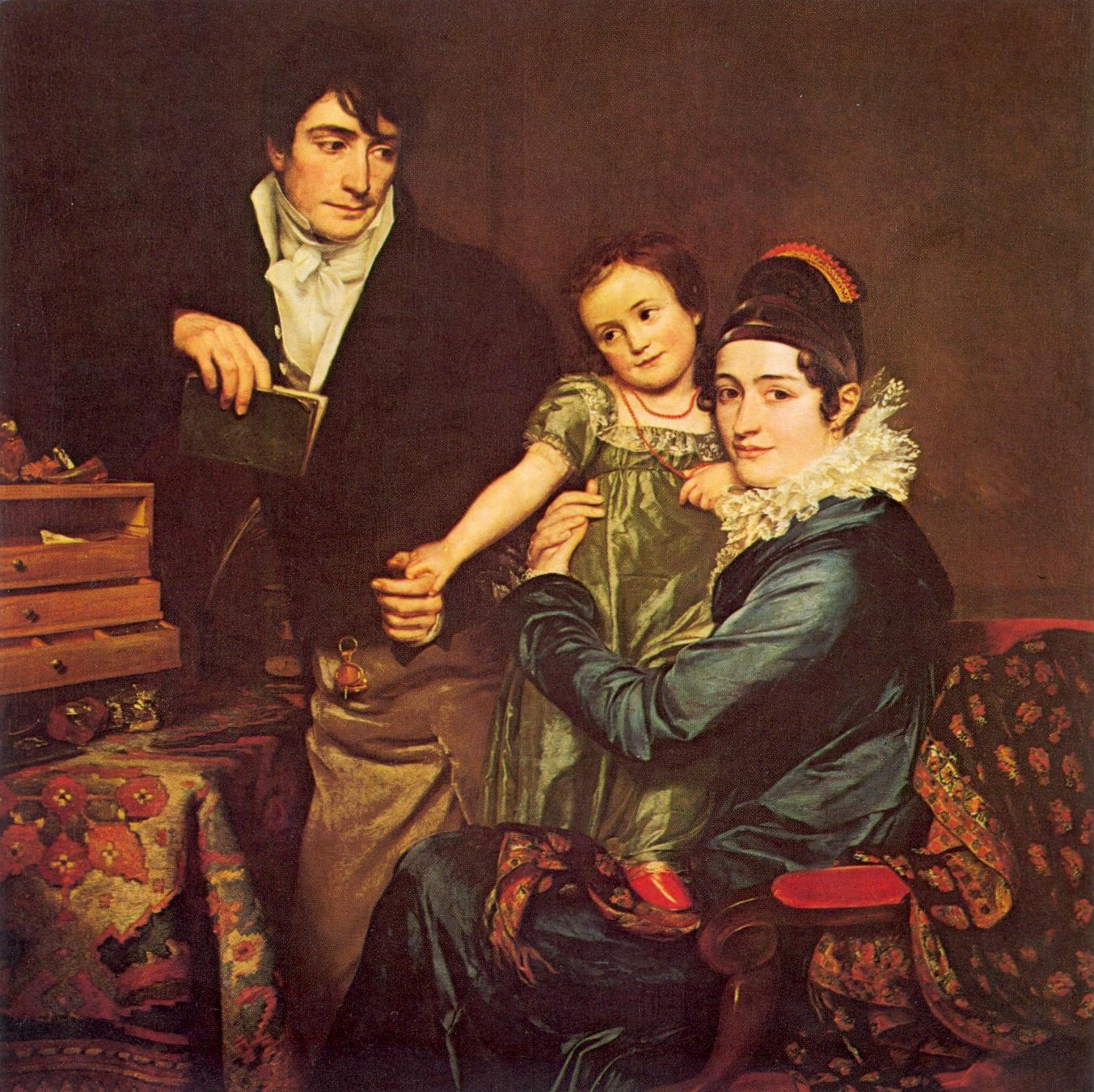
Albert d'Haenens Un passé pour 10 millions de Belges Bibliocassette 1 Vies quotidiennes