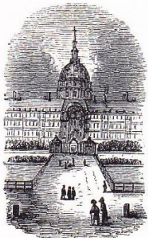
Hôtel royal des Invalides.