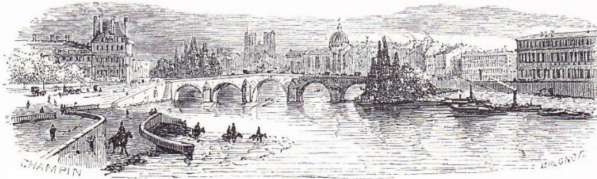
— Vue prise du pont de la Concorde. — Le pont Royal. — Les quais des Tuileries et d'Orsay.