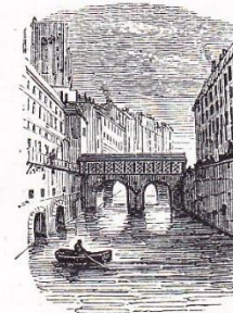
Pont de l'Hôtel-Dieu.