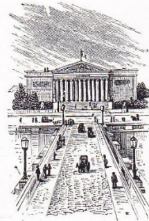
Chambre des Députés. Pont de la Concorde.