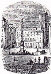
Place du Châtelet.