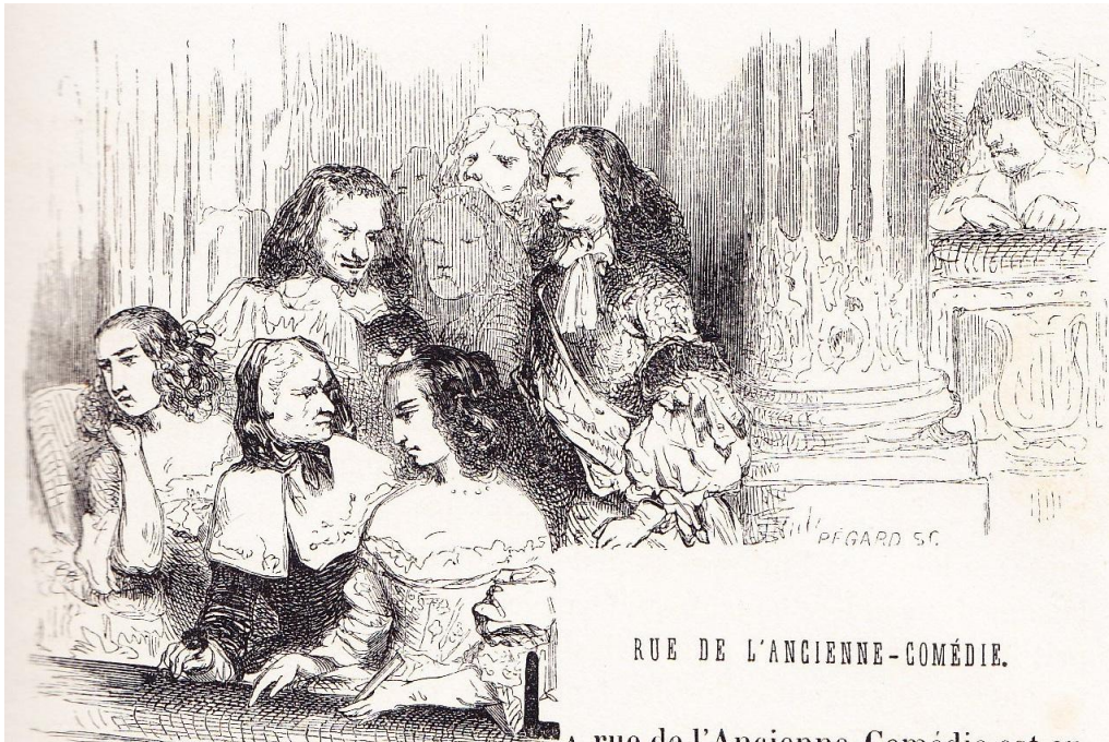
RUE DE L'ANCIENNE-COMÉDIE.