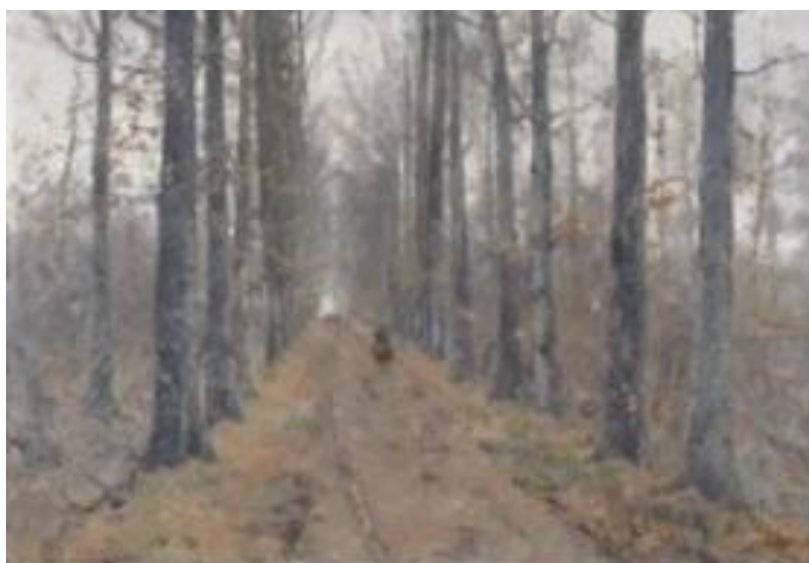
Forêt de Soignes

Adolphe HAMESSE peignait aussi mais son talent fut longtemps méconnu. En voici un échantillonnage : « Forêt de Soignes », « Arbre », « Automne », « Paysage », « Le moulin à eau ».