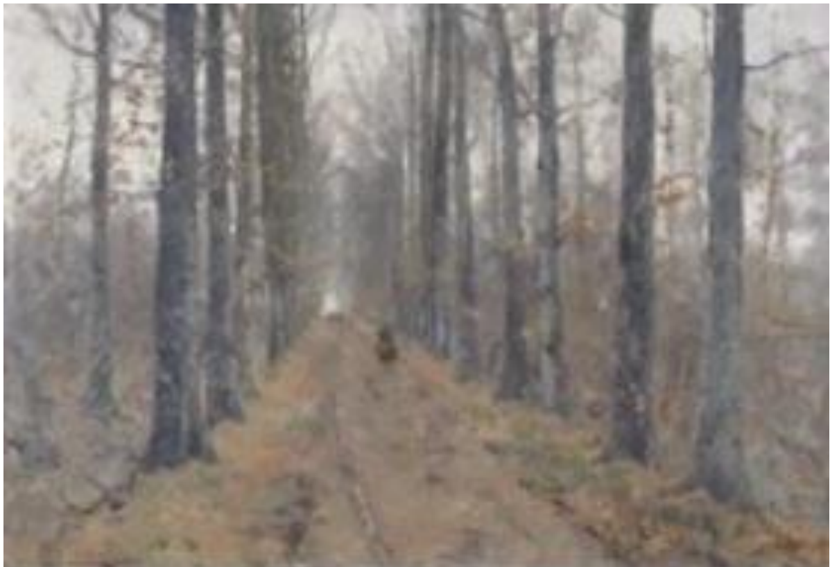
Forêt de Soignes

Adolphe HAMESSE peignait aussi mais son talent fut longtemps méconnu. En voici un échantillonnage : « Forêt de Soignes », « Arbre », « Automne », « Paysage », « Le moulin à eau ».