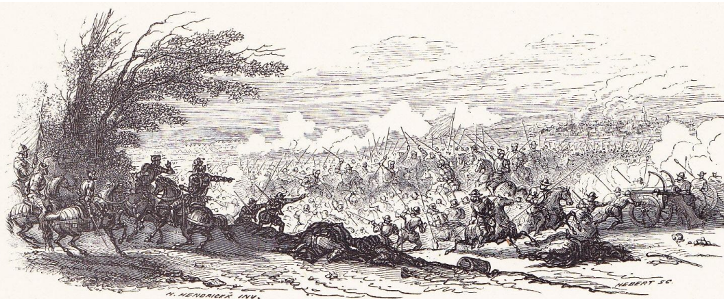
BATAILLE DE GRAVELINES (1558).