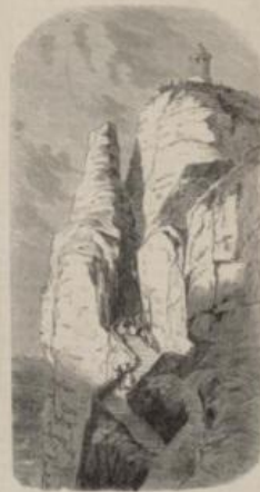
Château de la capitale