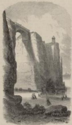
La grande arche