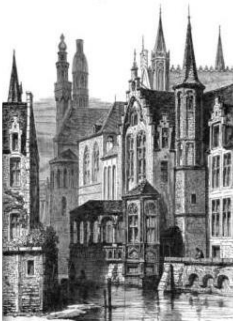
VUE D'UN ANCIEN CANAL.