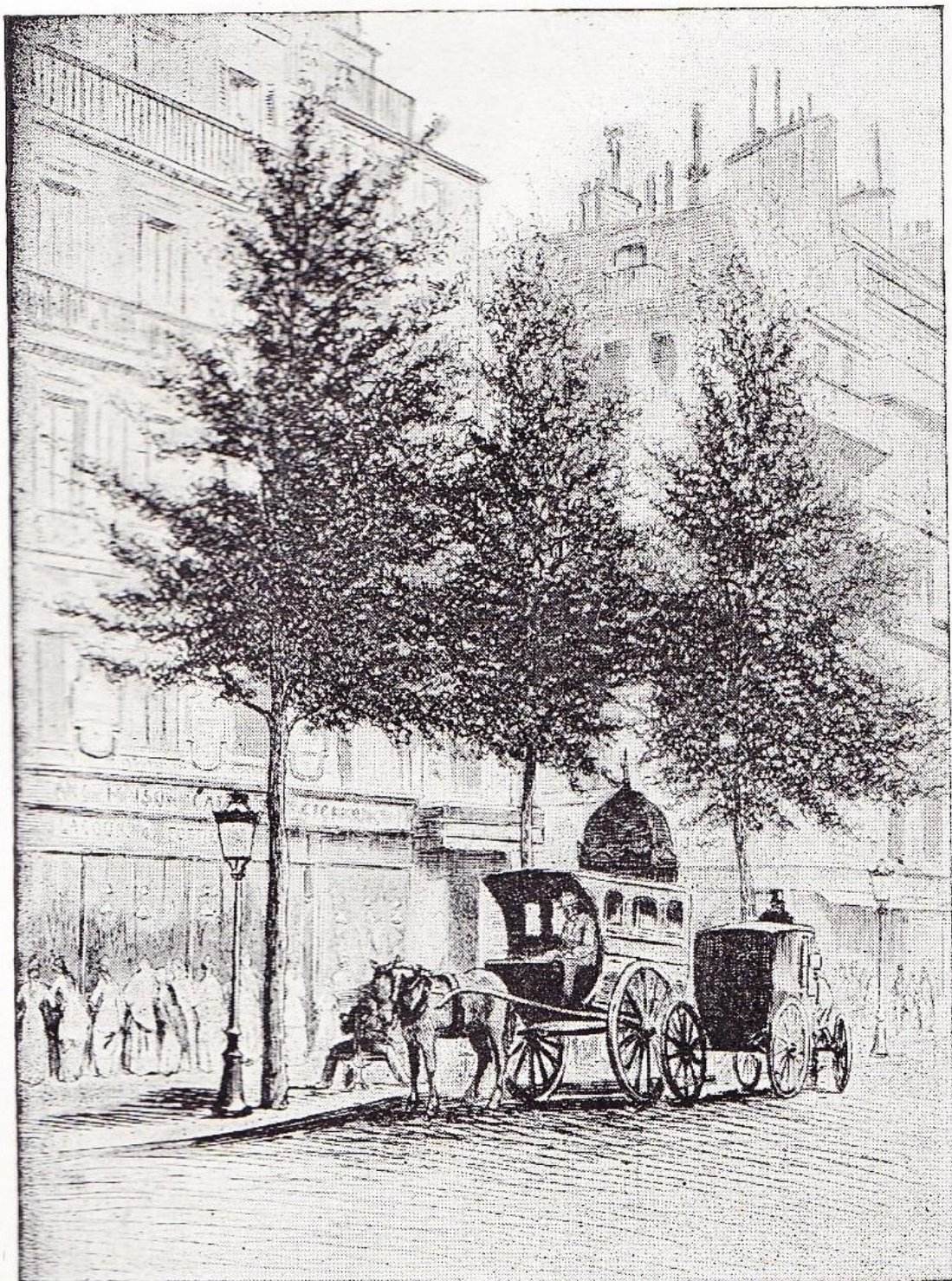
LES BOULEVARIS DE PARIS BOULEVARD DES CAPUCINES, COIN DE LA RUE DUPHOT Eau-forte de Martial POTHÉMONT. (Collection V. Prouté.)