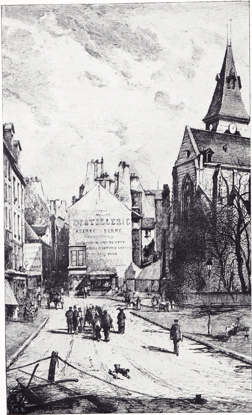
L'ÉGLISE DE SAINT-MÉDARD

Eau-forte de Lucien GAUTHIER. — (Collection de l'Art. )