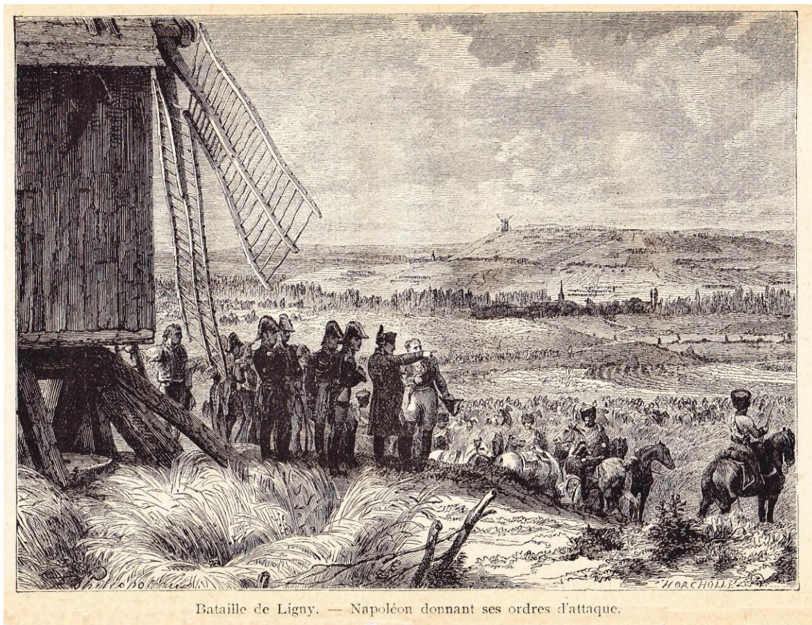
Bataille de Ligny. — Napoléon donnant ses ordres d'attaque.

Il s'agit vraisemblablement du même moulin figurant dans l'illustration suivante gravée d'après Félix Philippoteaux (1815-1884) : https://data.bnf.fr/fr/11919593/felix_philippoteaux/