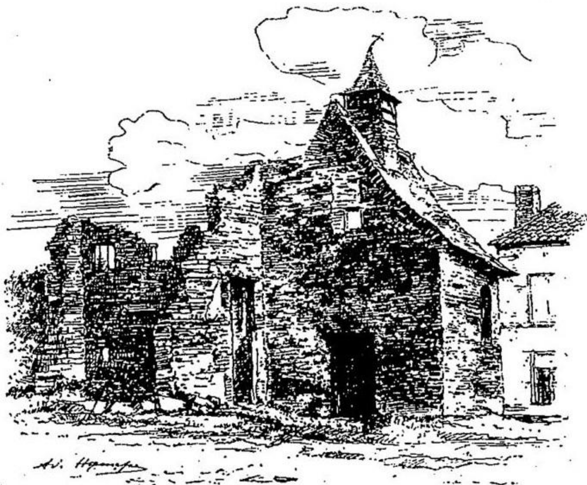
Ruines de la chapelle d'Hougoumont.

“ Ruines de la chapelle d'Hougoumont ” dans BARRAL , Itinéraire illustré de l'épopée de Waterloo (1896), page 107.