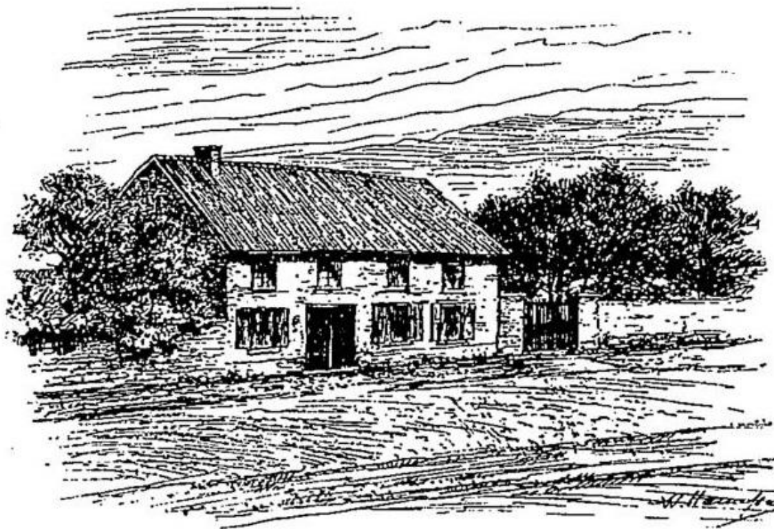
Ferme du Caillou, où Napoléon arriva le 17 juin 1815.

“ Ferme du Caillou ” (Genappe), dans BARRAL , Itinéraire illustré de l'épopée de Waterloo (1896), page 65.