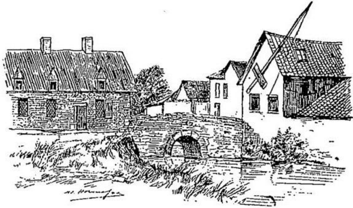
Pont sur la Dyle au Vieux-Genappe, en 1815.

“ Pont sur la Dyle aux Vieux-Genappe en 1815 ”, dans BARRAL , Itinéraire illustré de l'épopée de Waterloo (1896), page 91.