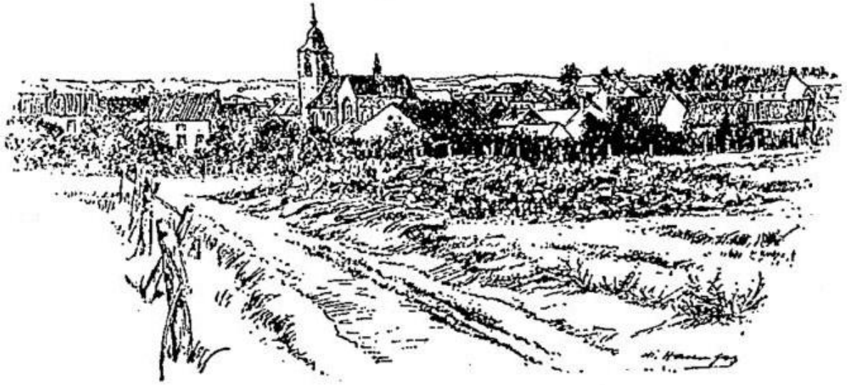
Vue générale de Braine-l'Alleud.

“ Vue générale de Braine-l'Alleud ” dans BARRAL , Itinéraire illustré de l'épopée de Waterloo (1896), page 61.