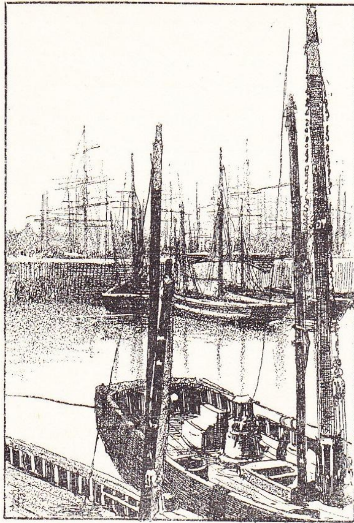
Les bassins de Dunkerque.