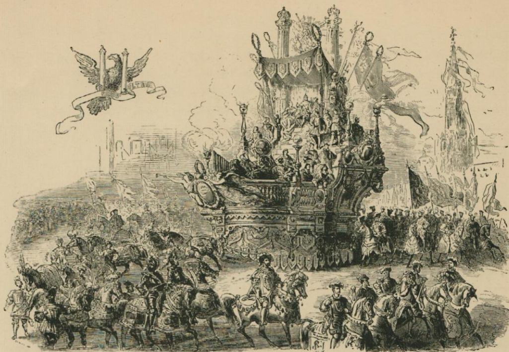
Char du Brabant.