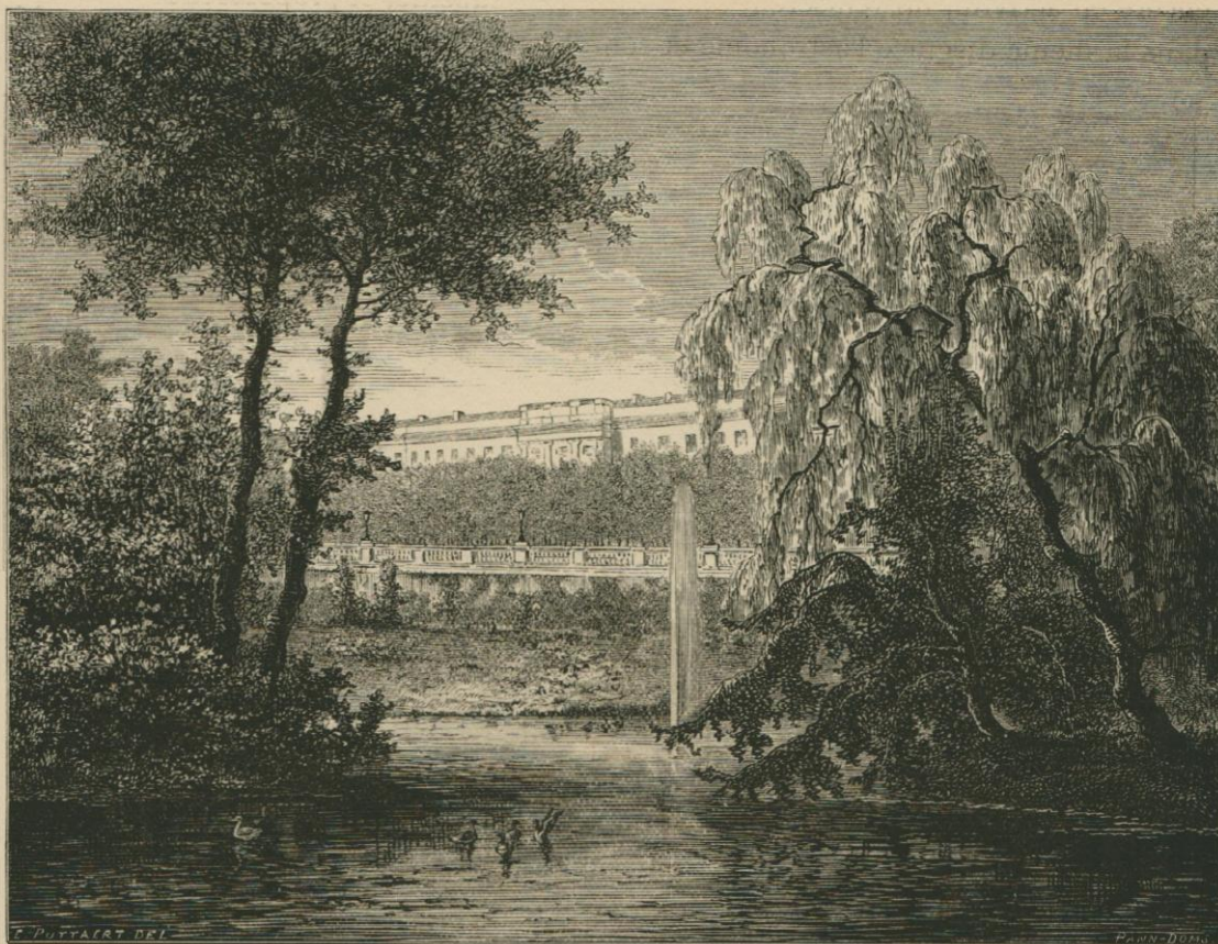
HOPITAL SAINT-JEAN ET BOULEVARD. VUE PRISE DES BAS-FONDS DU JARDIN BOTANIQUE.

trouvé, de pouvoir remplir la mission qui m'est confiée et d'être à même de travailler d'une manière utile à la science. Comme citoyen, je dois rougir même du soupçon de pouvoir être rangé parmi les sinécuristes , vraie lèpre des budgets, et, comme astronome, je ne dois pas oublier quelle responsabilité j'ai contractée devant le