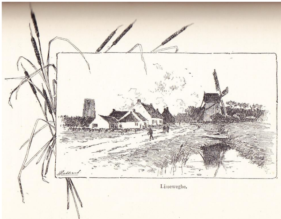
“Lisseweghe” à la page 351 de Jean D'ARDENNE , De Dunkerque à Dombourg (1888).

Nous avons apprécié la lithographie suivante, signée Henry CASSIERS, relative à la côte belge et antérieure (1888) aux destructions perpétrées par les Allemands pendant la première guerre mondiale de 1914-1918.