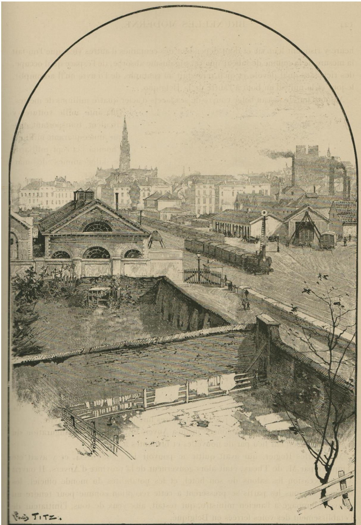
L'ANCIENNE GARE DU MIDI.

Dessin de Louis Titz, d'après une photographie prise immédiatement avant le déplacement de la gare.