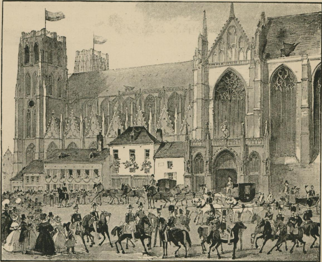
CORTÈGE POUR LA CÉRÉMONIE DU BAPTÊME DU PREMIER FILS DE LEOPOLD I er , LE 8 AOUT 1833.

Ainsi, en moins d'une année, l'œuvre de 1830 était définitivement accomplie. Assis sur une royauté sympathique à l'Europe, l'édifice élevé par les hommes de septembre pouvait résister impunément aux bourrasques et aux orages.